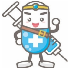
勇者コウキン (抗菌薬をイメージ)