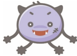
サイキン (細菌をイメージ)