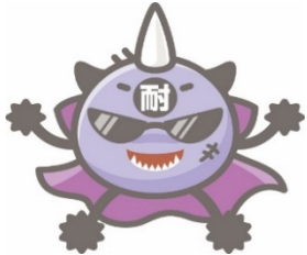
タイセイキン (耐性菌をイメージ)