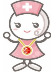
きゅあ嬢 (抗菌薬をイメージ)