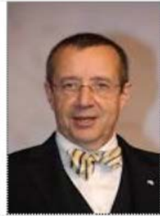
トーマス・イルヴェス大統領 (当時)

イタリアでは法人設立登記に18ヶ月かかりますが、 エストニアでは18分で すみます。 役員全員のIDを入力すればいいからです。