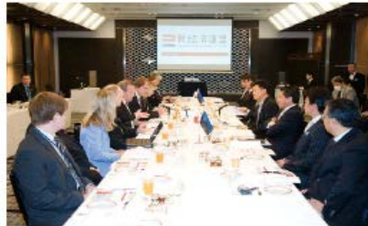
2014年3月6日 エストニア大統領と新経済連盟との意見交換会

イタリアでは法人設立登記に18ヶ月かかりますが、 エストニアでは18分で すみます。 役員全員のIDを入力すればいいからです。